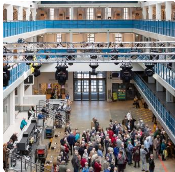
Stadtbibliothek im HP8