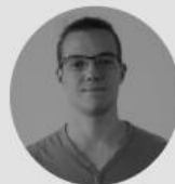
Gregory Neumann Sensorik